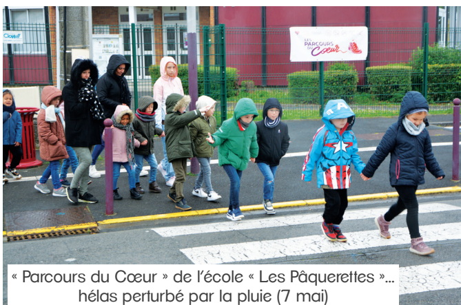
« Parcours du Cœur » de l'école « Les Pâquerettes »... hélas perturbé par la pluie (7 mai)