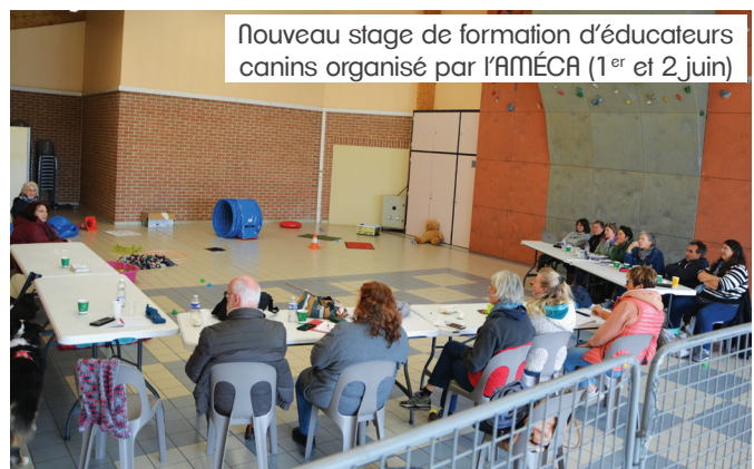
Nouveau stage de formation d'éducateurs canins organisé par l'AMÉCA (1 er et 2 juin)