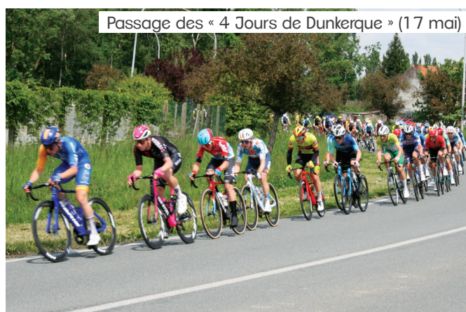
Passage des « 4 Jours de Dunkerque » (17 mai)