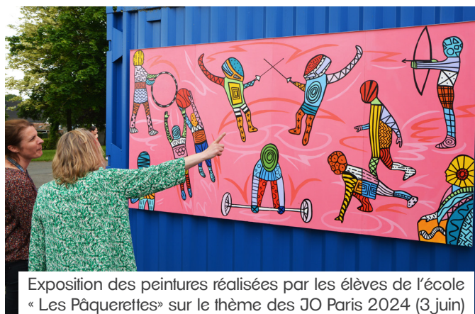
Exposition des peintures réalisées par les élèves de l'école « Les Pâquerettes » sur le thème des JO Paris 2024 (3 juin)