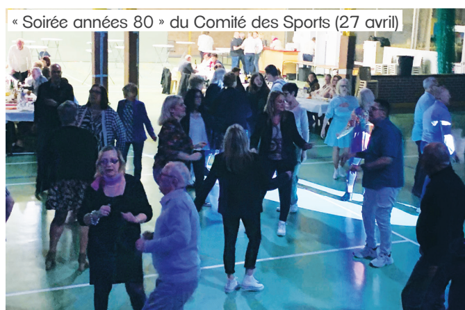
« Soirée années 80 » du Comité des Sports (27 avril)