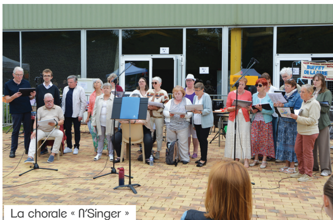
La chorale « N'Singer »