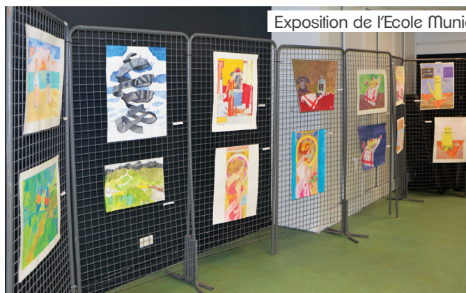
Exposition de l'Ecole Municipale de Dessin (26-28 avril)