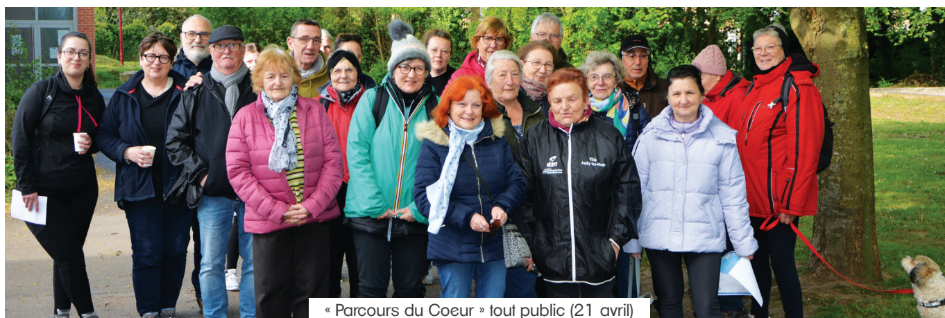
« Parcours du Coeur » tout public (21 avril)