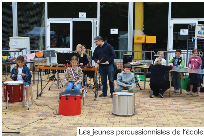
Les jeunes percussionnistes de l'école

C'est le samedi 8 juin que s'est déroulée la 2 ème édition des « FêArts » dans le parc du Complexe Omnisports.