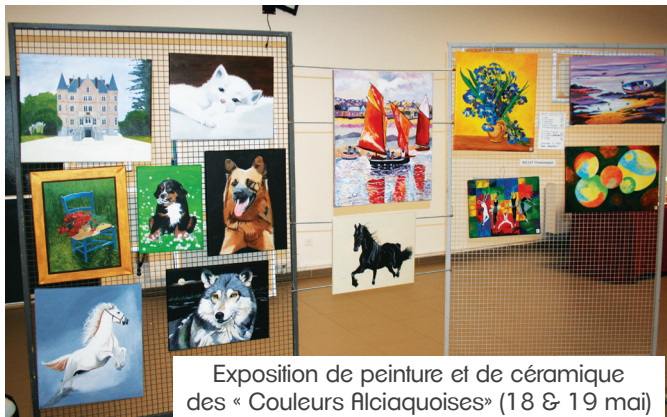
Exposition de peinture et de céramique des « Couleurs Alciaquoises » (18 & 19 mai)

Calendrier des randonnées sur le site internet de la ville (rubrique Agenda) et sur Auchy Connect (onglet associations).