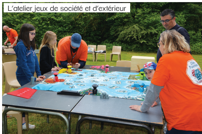
L'atelier jeux de société et d'extérieur