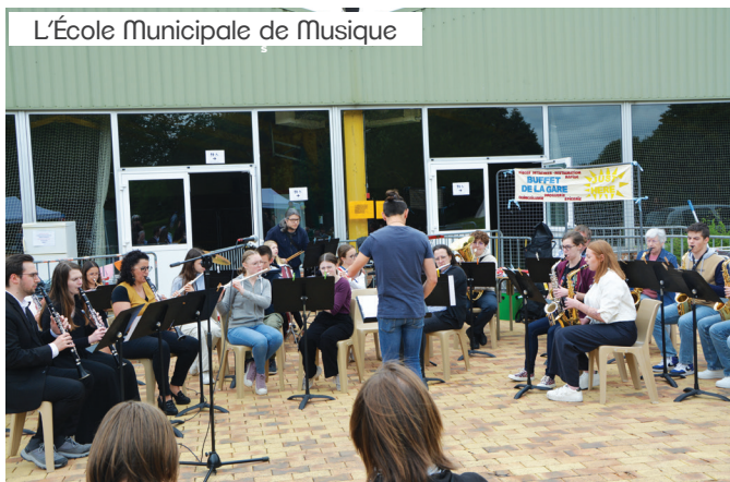
L'École Municipale de Musique