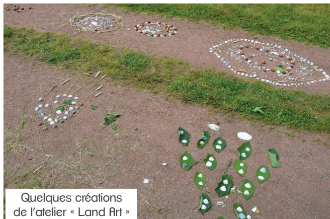
Quelques créations de l'atelier « Land Art »