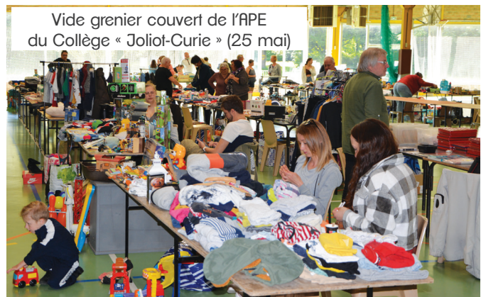
Vide grenier couvert de l'APE du Collège « Joliot-Curie » (25 mai)