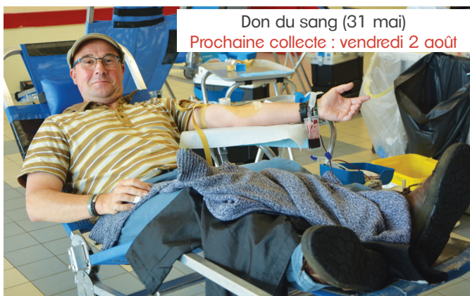
Don du sang (31 mai) Prochaine collecte : vendredi 2 août