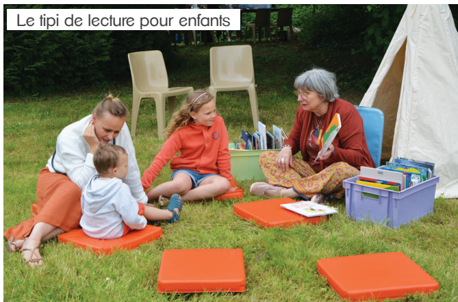
Le tipi de lecture pour enfants

Bravo à tous les bénévoles, participants et partenaires ayant contribué au succès de ce rendez-vous culturel que vous pourrez retrouver en 2025.