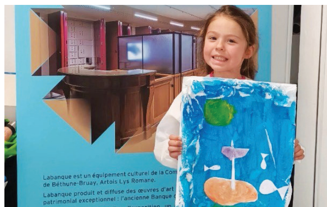
Labanque est un équipement culturel de la Com de Béthune-Bruay, Artois Lys Romane. Labanque produit et diffuse des œuvres d'art patrimonial exceptionnel : l'ancienne Banque d

Dans notre ville, cet hommage s'est déroulé au Pôle Culturel « Charles Aznavour » le 22 mai dernier sous la forme d'un atelier « Peinture & Matière » ouvert aux enfants à partir de 6 ans (accompagnés d'un parent) pour créer des œuvres inspirées de celles de l'artiste. Une façon ludique de découvrir l'art de ce grand peintre régional.